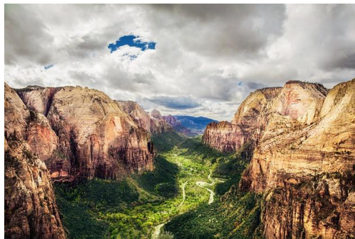
Abbildung 4