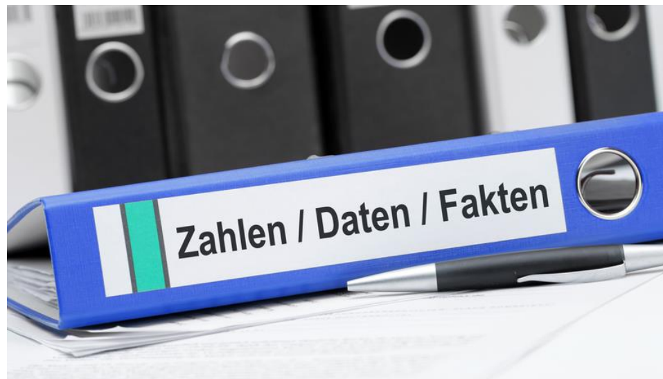
Abbildung 2